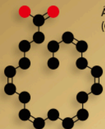
Ácido Eicosapentaenóico (Omega-3)